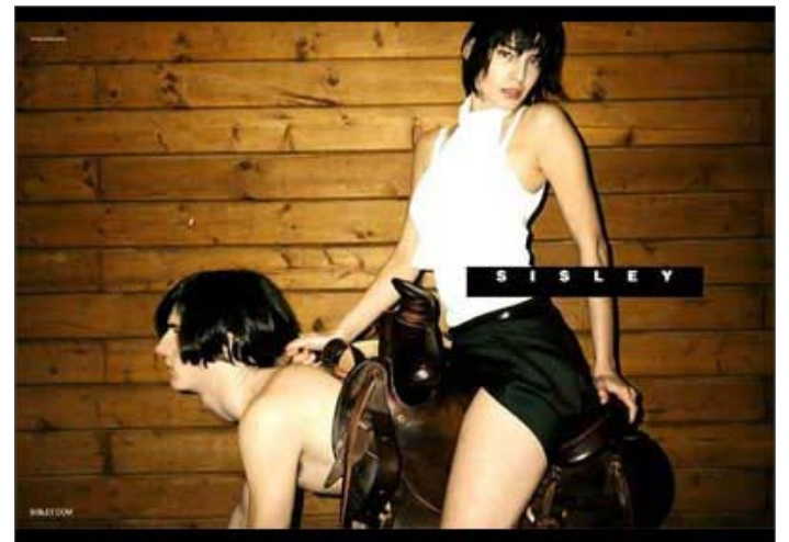
- RIDICOLO -