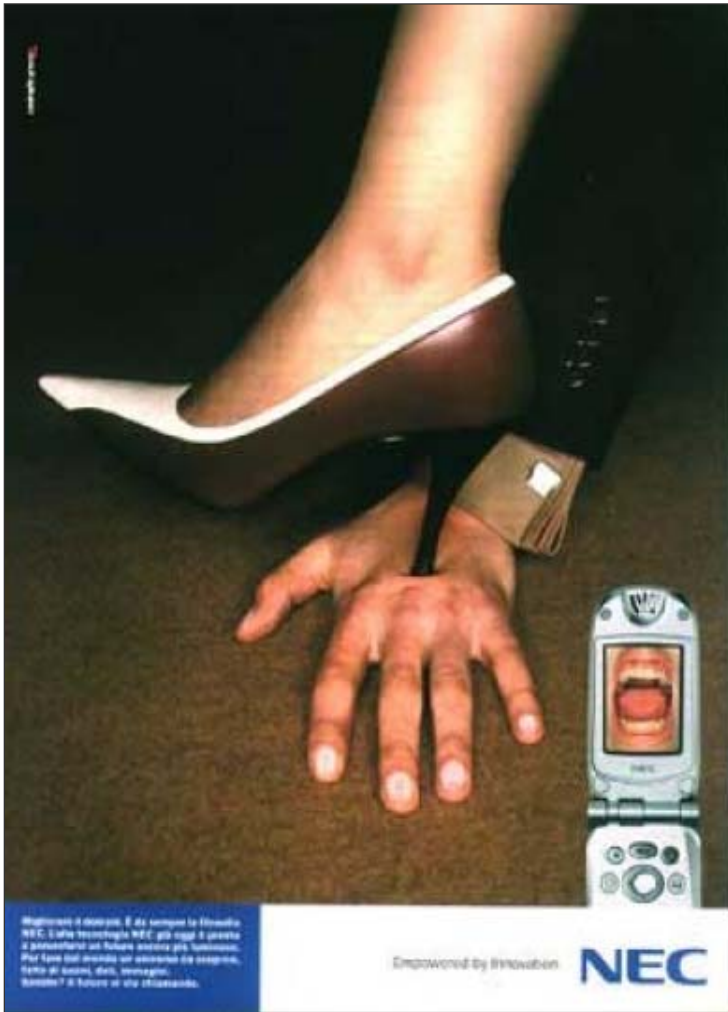
- ZERBINO -